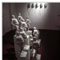
( http://insideart.eu/wp-content/uploads/2015/03/1043088.jpg )

Alessia Carlino ( http://insideart.eu/author/alessia-carlino/ )