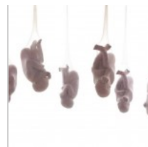
( http://insideart.eu/wp-content/uploads/2015/03/1043084.jpg )