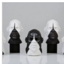
( http://insideart.eu/wp-content/uploads/2015/03/1043082.jpg )