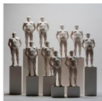
( http://insideart.eu/wp-content/uploads/2015/03/1043081.jpg )