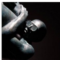
( http://insideart.eu/wp-content/uploads/2015/03/1043080.jpg )