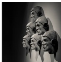
( http://insideart.eu/wp-content/uploads/2015/03/1043083.jpg )