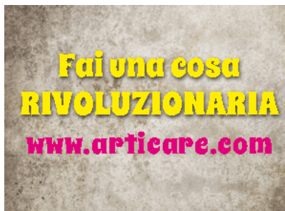
( http://articare.insideart.eu/ )