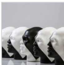
( http://insideart.eu/wp-content/uploads/2015/03/1043085.jpg )